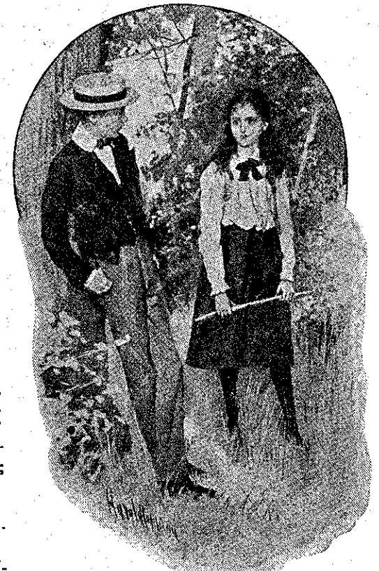
«Γιατί εἶνε κόκκινα τὰ μάτια σου;» (Σελ. 253.)

— Μὴν το λές, Μάριε, μὴν το λές ἔτσι! Κ' ἐσύ θάκλαιγες, ἂν ἦσουν σὰν ἐμένα... Τῆς εἶπα νὰ τὴν κάμω ἀδελφὴ μου, νὰ τῆς δώσω ὠραῖα ρούχα,