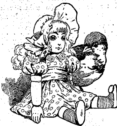
Μιὰ μικρούλα κουκλίτσα...

Ὁ Σπουργιτάκης τὸ ἀκούει, καὶ... πετᾷ κυριολεκτικῶς ἀπὸ τὴν χαρὰ του.